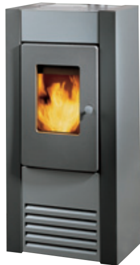
Kea I: Verkleidung in Stahlblech lackiert Front: 2-farbig anthrazit und silber Seitlich: anthrazit durchgehend