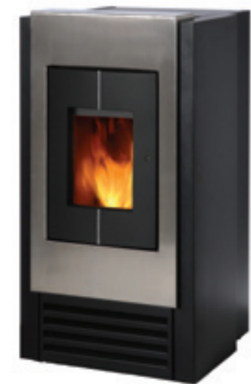
Taos I: Verkleidung schwarz Front: silber

* Optional in Verbindung mit Raumluftgebläse